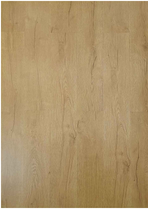
▲ AMBER OAK 20031