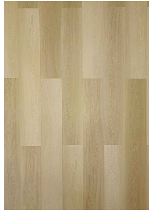
▲ GOLDEN OAK 45109