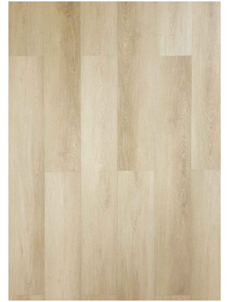
▲ NATURAL OAK 62657